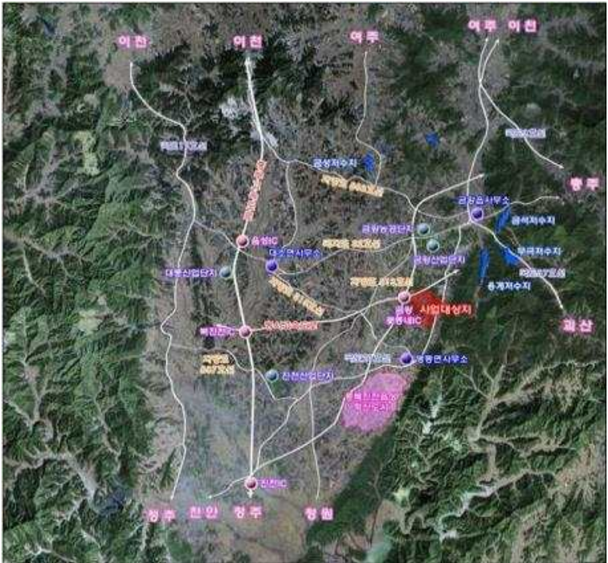
< 위치도 >