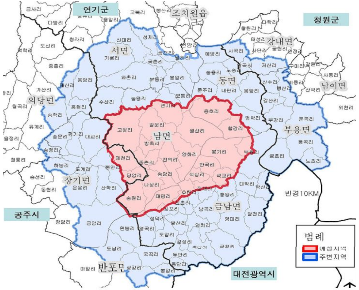
(’06.12.31 주민등록 기준)