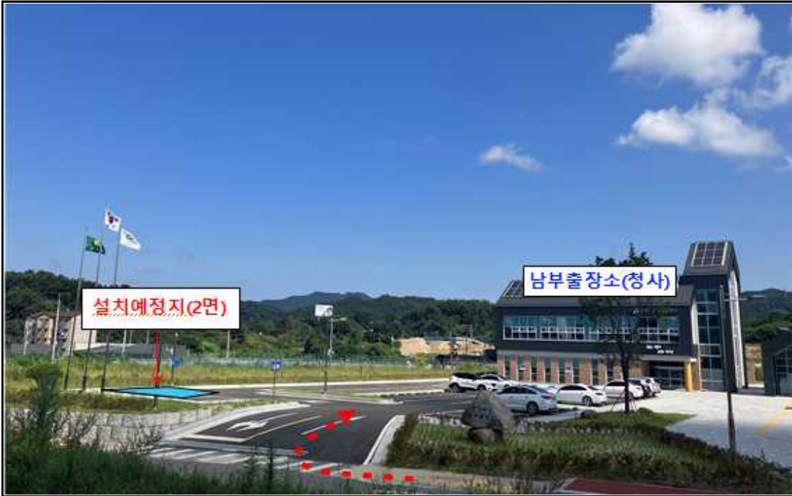
충청북도남부출장소 주차장 내 설치(2개소)