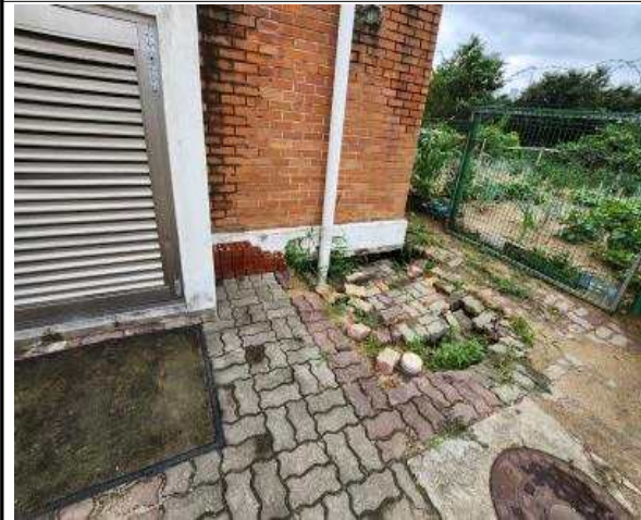
외부(정화조 보수 필요)