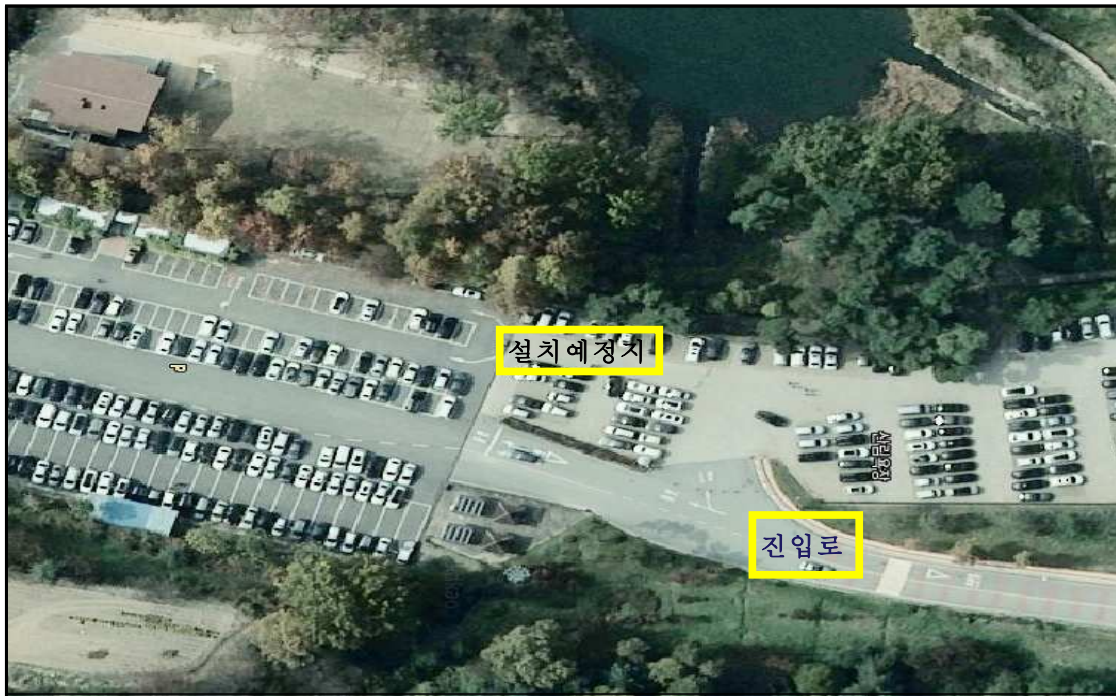
민원인 주차장 내 8면 설치