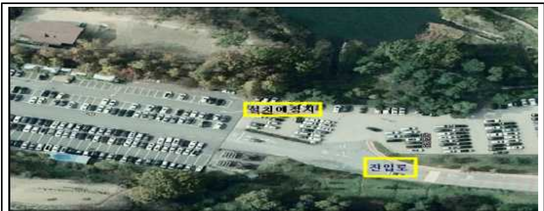
민원인 주차장 내 8면 설치