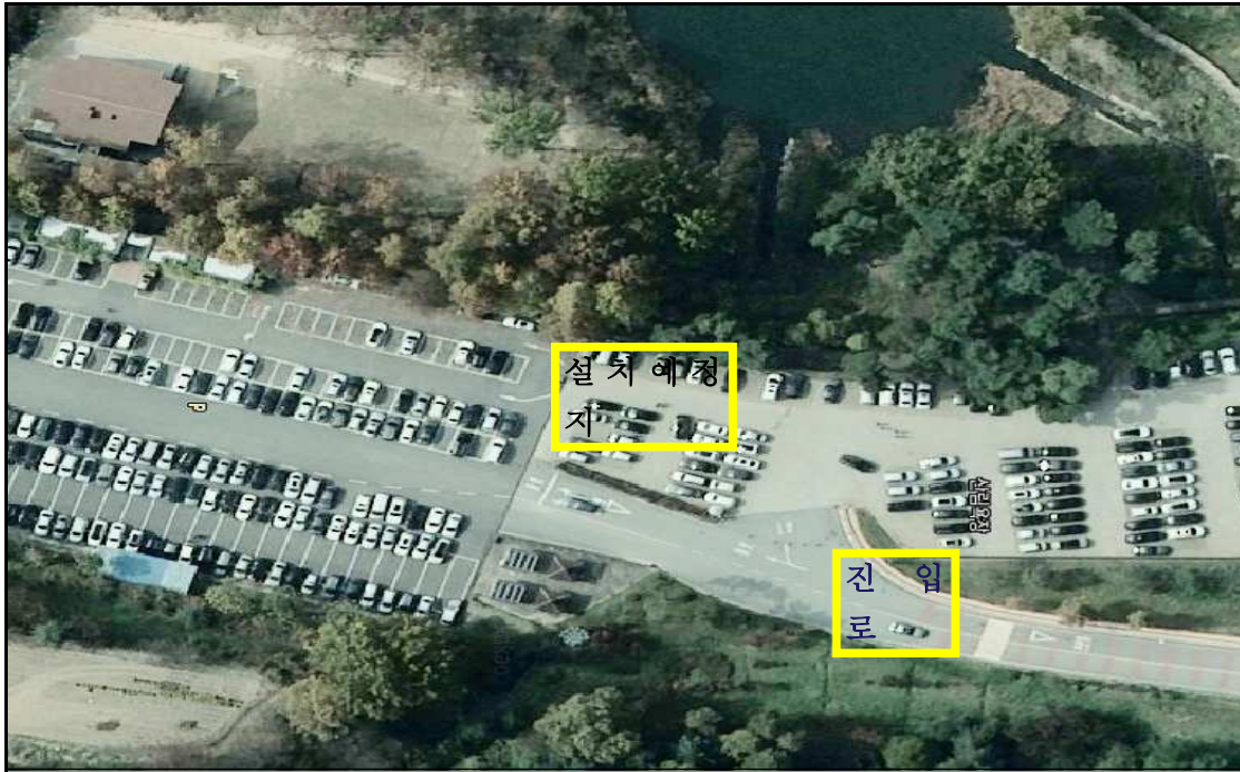
민원인 주차장 내 8면 설치