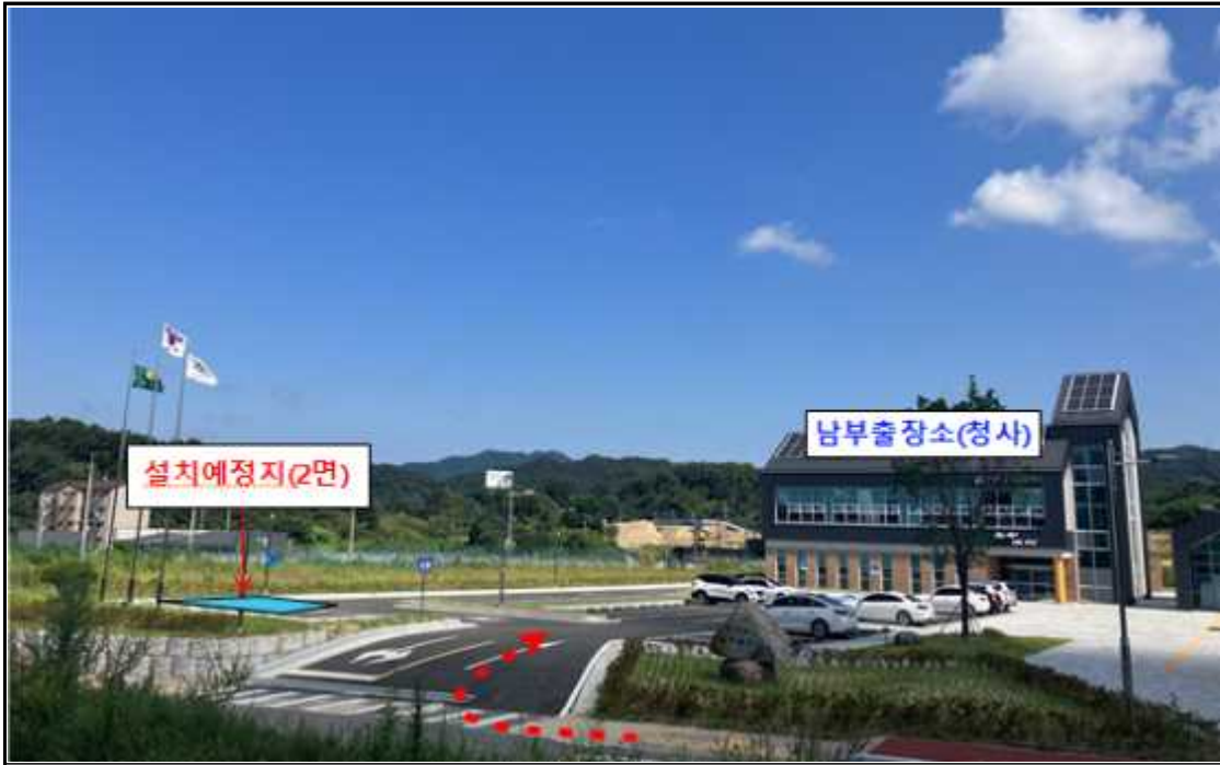
충청북도남부출장소 주차장 내 설치(2개소)