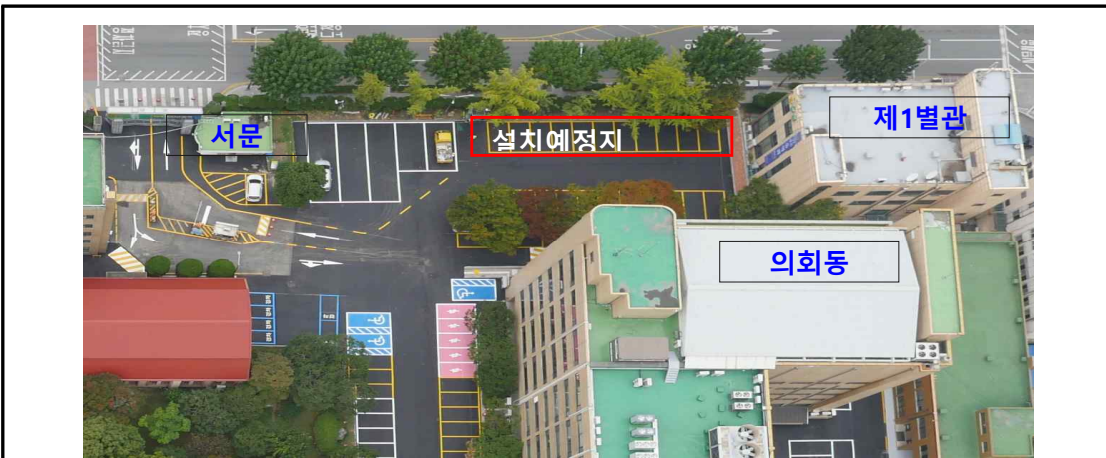
민원인 주차장 내 2면 설치(세부적 위치 설계 시 확정)